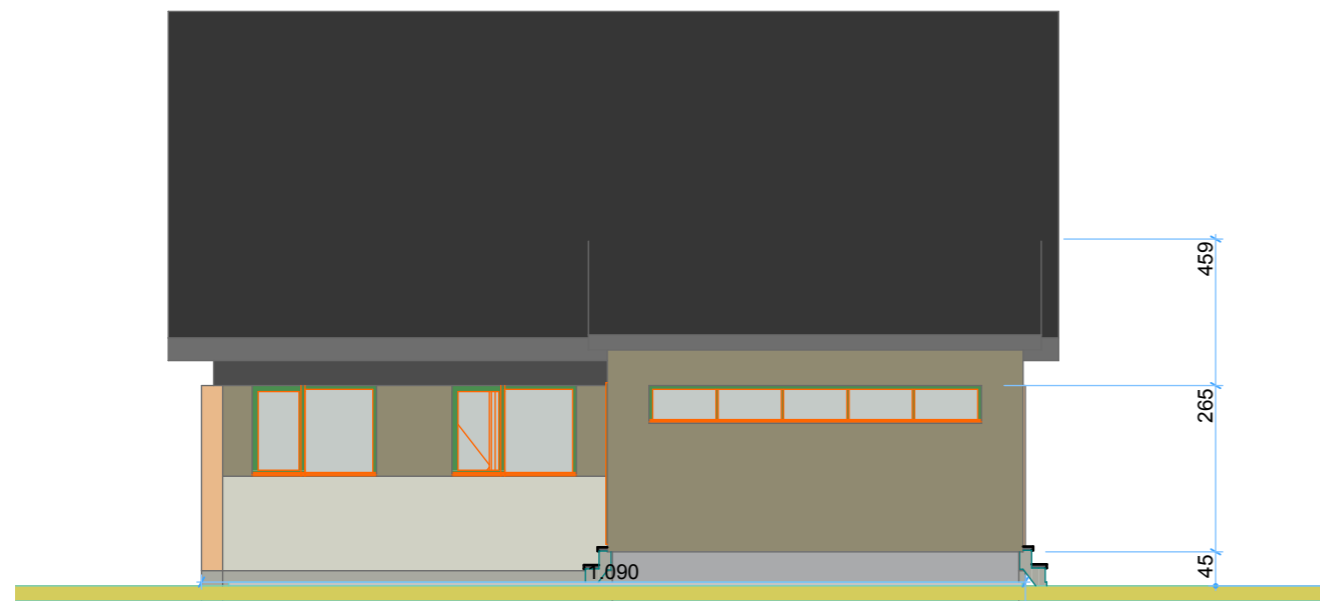
4 West Elevation 1:100